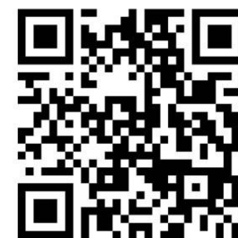
Youtube: ทุนส่งเสริมโอกาส การเรียนรู้ที่ใช้ชุมชนเป็นฐาน