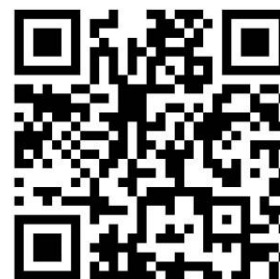
Facebook: ทุนส่งเสริมโอกาส การเรียนรู้ที่ใช้ชุมชนเป็นฐาน

06 5964 1364 หรือ 06 5964 1354 (ในวันและเวลาราชการ)