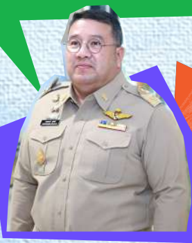
พันตำรวจโทวรรณพงษ์ คชรักษ์ อธิบดีกรมพินิจและคุ้มครองเด็กและเยาวชน

“ในเชิงปริมาณ เยาวชนกลุ่มนี้อาจนับว่าเป็นเพียง กลุ่มน้อยในสังคม แต่เมื่ออ้างอิง 'ทฤษฎีผีเสื้อขยับปีก' (Butterfly Effect) แล้ว คนเพียงคนหนึ่งนั้นสามารถสร้างผลกระทบ ที่ยิ่งใหญ่ให้กับสังคมได้ ถ้าเขาไม่ได้รับการดูแลเอาใจใส่ที่เพียงพอ ดังนั้น เราจะไม่ยอมทิ้งใครไว้แม้แต่คนเดียว เด็กเยาวชนทุกคนไม่ว่าใครก็ตาม เขาควรได้รับ โอกาส ในการพัฒนาตนเอง เพื่อไปให้สุดเส้นทางตามศักยภาพที่เขามี”