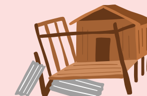
การอยู่อาศัยไม่มั่นคงปลอดภัย