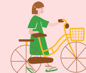
ยานพาหนะ