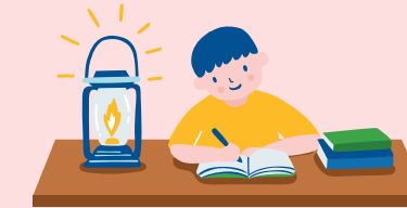
แหล่งไฟฟ้านัก