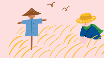
ที่ดินทำการเกษตรได้