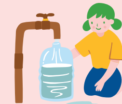
แหล่งน้ำดื่มน้ำใช้