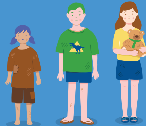
ยากจนพิเศษ ยากจน ยากจนน้อย

ได้นักเรียนยากจน 3 ระดับ คือ ยากจนน้อย ยากจน และยากจนพิเศษ