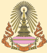
คณะครุศาสตร์ จุฬาลงกรณ์มหาวิทยาลัย