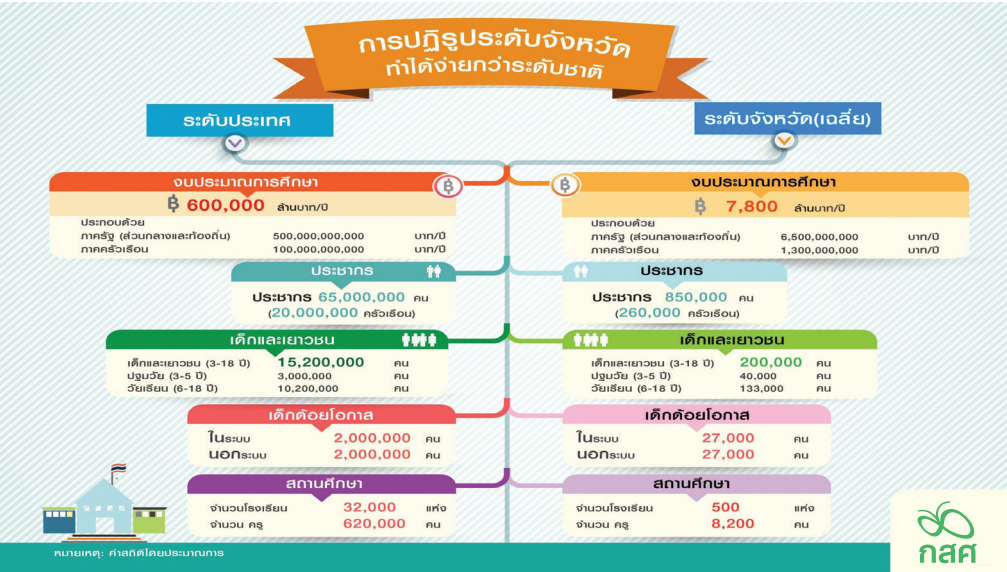
ภาพเปรียบเทียบทรัพยากรและองค์ประกอบที่ต้องบริหารจัดการในการปฏิรูปการศึกษาระหว่างระดับประเทศกับระดับจังหวัด

ดังเห็นได้จากภาพที่แสดงข้อมูลเปรียบเทียบปริมาณทรัพยากร ขนาดกลุ่มเป้าหมาย และพื้นที่ปฏิบัติการ ระหว่างการปฏิรูป ระดับประเทศ กับ ระดับจังหวัด ที่ระดับหลังบริหารจัดการได้ง่ายกว่า