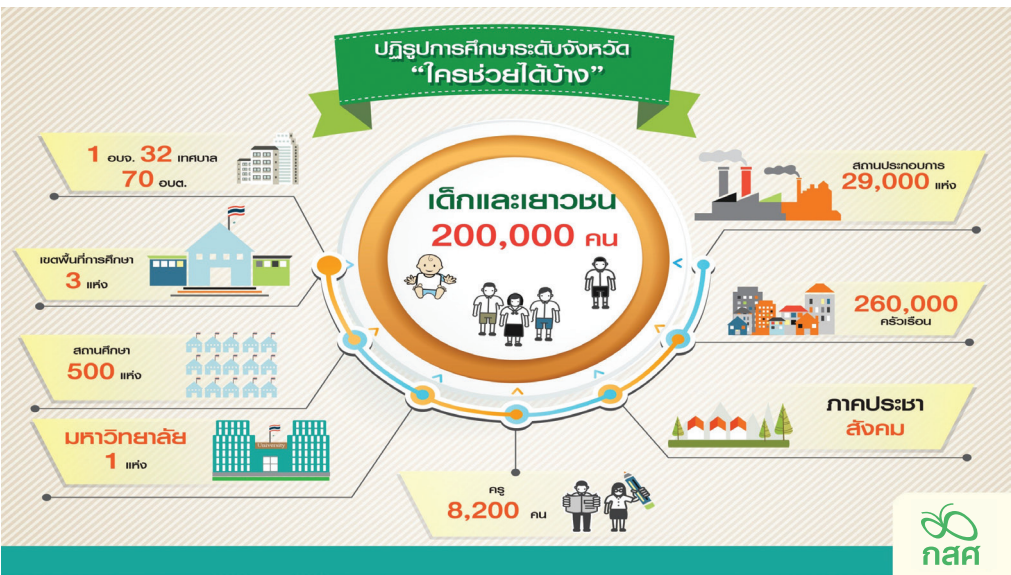
ภาพแสดงตัวอย่างผู้มีส่วนเกี่ยวข้องในการสนับสนุนการปฏิรูปการศึกษาระดับจังหวัด

นั่นคือจุดพลิกผันที่ทำให้เรื่องยากและซับซ้อนอย่างเช่น “การปฏิรูปการศึกษา” เดินหน้ามาได้จนถึงจุดนี้ ภายในเวลาไม่ถึง 3 ปี